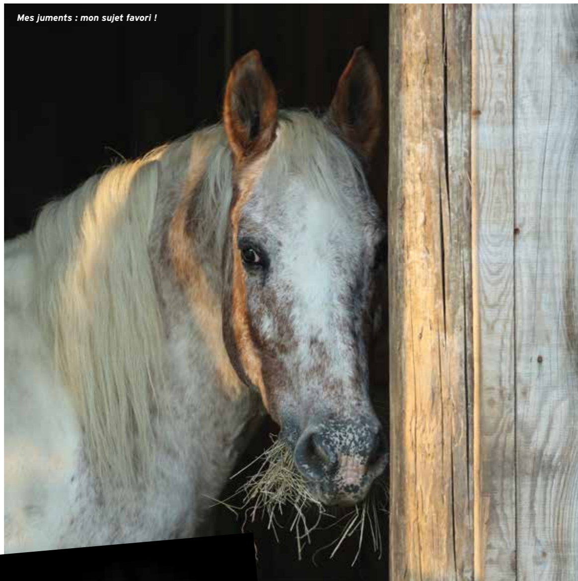
Mes juments : mon sujet favori !